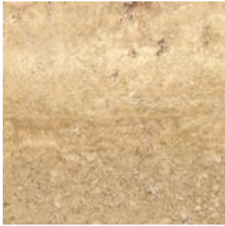
Travertino Oniciato: beige