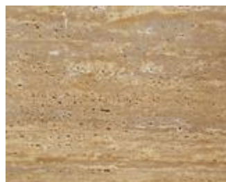
Travertino Noce csikos: sötétbarna